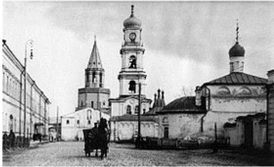
Собор (1596-1601 гг.), церковь Киприана и Иустины (1596 г.), церковь Николая Ратного (1558 г.), колокольня (1862 г.). Все храмы монастыря разобраны в 1927-1930 гг.